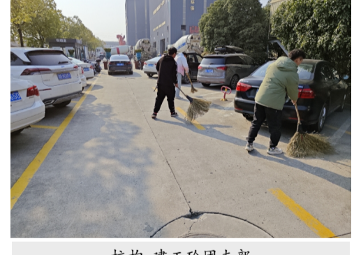
杭构·建工砼团支部