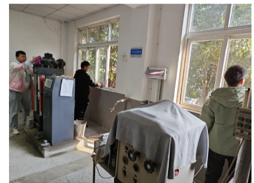
杭构·建工砼团支部