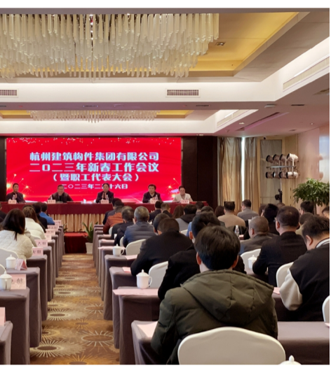
杭构集团 2023 年新春工作会暨职工代表大会现场

二、要坚持业务拓展再突破。手中有粮,心中不慌。杭构集团始终要把业务拓展作为首要工作来抓,积极抢占混凝土市场份额,抢抓地铁管片机遇,不断提升 PC 构件业务拓展能力,力争在新的一年里创造新