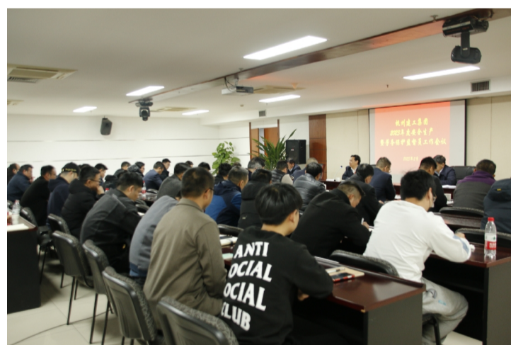
集团召开 2023 年度安全生产工作会

(上接第1版)一是要提高政治站位,压实安全主体责任。严格落实“管行业必须管安全、管业务必须管安全、管生产经营必须管安全”三个“必须”要求,切实开展好“落实企业安全生产主体责任年”活动,层层压实安全责任。