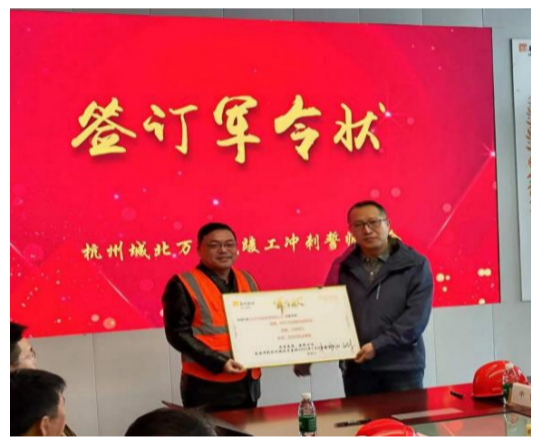
城北万象城竣工冲刺誓师大会,项目各参建单位签订军令状

目前该项目机电安装剩余工作量还有近 5000 万元,距离 7 月 8 日工程竣工备案完成时间节点只有 130 多天,工程体量大,时间紧,任务重,面对严峻的挑战,项目部春节期间不停工,节后劳动动力不断攀升,目前施工作业人员达 500 人,各工