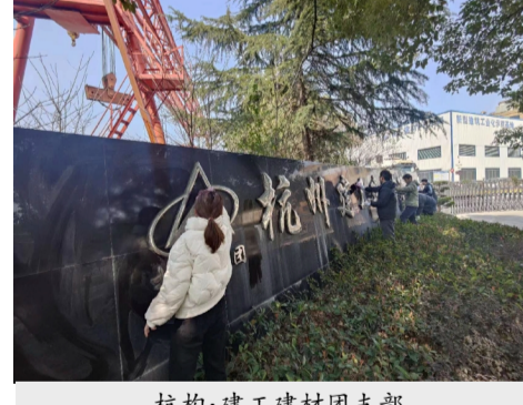
杭构·建工建材团支部