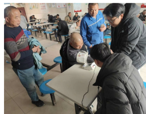
杭构·建工建材团支部