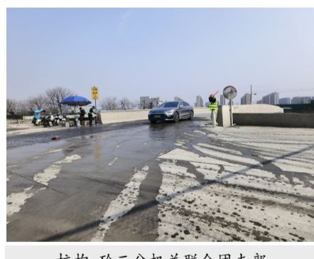
杭构·砼二机关联合团支部