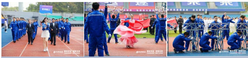
入场式(托起中国梦)展现新时代建设人的精神风貌