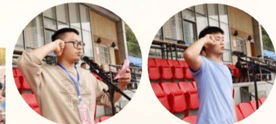
裁判员、运动员宣誓