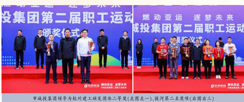
市城投集团领导为杭州建工颁发团体二等奖(左图左一),拔河第二名奖项(右图右三)