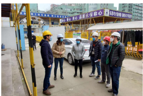
上城区建设局和纪委相关领导进行复工工作检查和指导