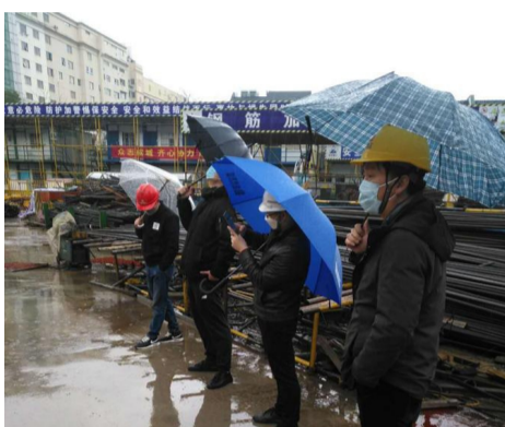
上城区质安站进行复工工作检查和指导

安全生产。开工前,项目部会同监理、建设单位对现场进行了安全隐患排查,重点针对起重机械、支模架、脚手架、基坑等危大工程做了专项检查,为安全复产提供必要保障条件。班组进场时,分批次组织对民工进行三级教育并组织民工观看节后安全复工培训视频,敲响安全警钟。每天,组织管理人员和班组长开展班前晨会,紧绷安全弦。