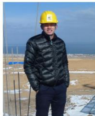
余江 技术质检部技术员

主要负责依据内部承包协议约定扣除各项费用和到期借款后的余额作为项目可用余额,根据已经审批好的收付款单登记两家分公司台帐,审核会计凭证等。完成两家分公司新老朋友的年度、月度报表,工程项目内外对账,登记内部承包合同、主材等合同的备查帐及相关表格等工作,做好项目资金执行收支计划表,参与项目责任成本管理,根据责任成本目标或费用预算,协助项目经理做好成本和费用控制,减少项目风险。