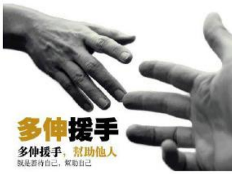
多伸援手 多伸援手，帮助他人 就是帮助自己，帮助自己

杭州市2015年“春风行动”已启动，为积极响应号召，集团及下属杭安、杭构共捐款5万元，献出了一份爱心力量。